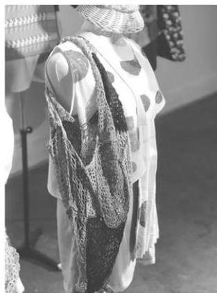
กระเป๋าตาข่ายดีไซน์เก๋จากภูมิปัญญาคนริมน้ำโขง

สำหรับ 10 ผลิตภัณฑ์ต้นแบบที่คัดสรรมาให้ชม ประกอบด้วย ผลิตภัณฑ์จากเมืองเก่าเชียงแสน 5 รายการ ได้แก่