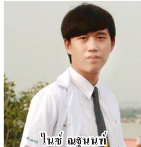
ไนซ์ ณฐนนท์

อย่างดี ในการลงพื้นที่เขาสามมุข จ.ชลบุรี ชาวบ้านจำนวนมากมีอาชีพแกะหอยขาย ต้องนั่งแกะหอยนานหลายชั่วโมงติดต่อกันทั้งวัน ทำให้ร่างกายมีค่า BMI (ค่าดัชนีชี้วัดความสมดุลของน้ำหนักตัวและส่วนสูง) เกินค่ามาตรฐาน เนื่องจากขาดการออกกำลังกาย จึงจัดทำโครงการ "ห่วงใย ไร้พุง" ร่วมกับเพื่อนๆ ที่เรียนด้วยกัน รณรงค์ชาวบ้านและผู้สูงอายุในพื้นที่ชุมชนเขาสามมุขมาออกกำลังกายอย่างสม่ำเสมอ มีผู้สนใจเข้าร่วมโครงการกว่า 50 คน ซึ่งทำให้เรามีกำลังใจและแรงบันดาลใจสร้างประโยชน์ให้คนในชุมชนต่อไป