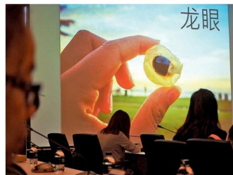
เป็นสะพานเชื่อมระหว่างองค์ความรู้และอาจารย์นักวิจัยจากภาคมหาวิทยาลัยสู่ภาค