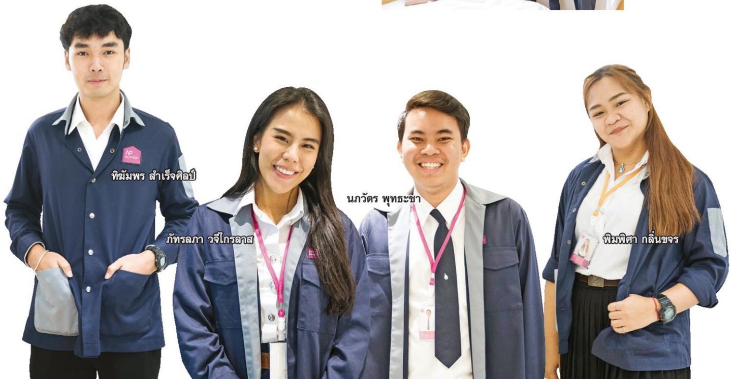
ทีมัมพร สำเร็จศิลป์