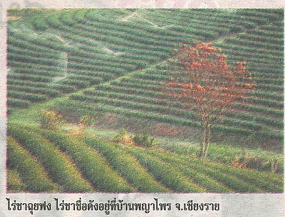
ไร่ชาดูฟง ไร่ชาชื่อดังอยู่ที่บ้านพญาไพร จ.เชียงราย