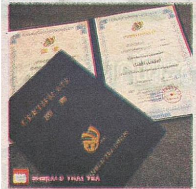
เกียรติบัตรรับรองชนะเลิศรางวัลเหรียญทองจากสาธารณรัฐเช็ก ของชาไทยมรกต โรงงานชาโชคจำเริญ

ประมาณ 17,500 ล้านบาท ชาใบ 400 ล้านบาท อื่นๆ 100 ล้านบาท) และมีอัตราการเจริญเติบโตมากกว่าร้อยละ 5 ต่อปีอย่างต่อเนื่อง ทำให้อุตสาหกรรมชาไทยเป็นที่น่าสนใจ เพราะระดับราคาของชาไทยเองยังอยู่ในระดับที่แข่งขันได้กับชาดีผู้ผลิตชาอื่นๆ และคุณภาพดีไม่เป็นรองใคร