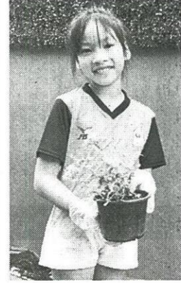
น้องแพรวปลูกต้นพยับหมอก