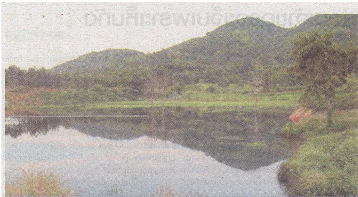
ทะเลสาบด้านหลังดอยแจ่มซึ่งมองเห็นอยู่ไกลๆ ในยามเย็นมักมีนกเปิดน้ำบินมาลงเป็นฝูงๆ